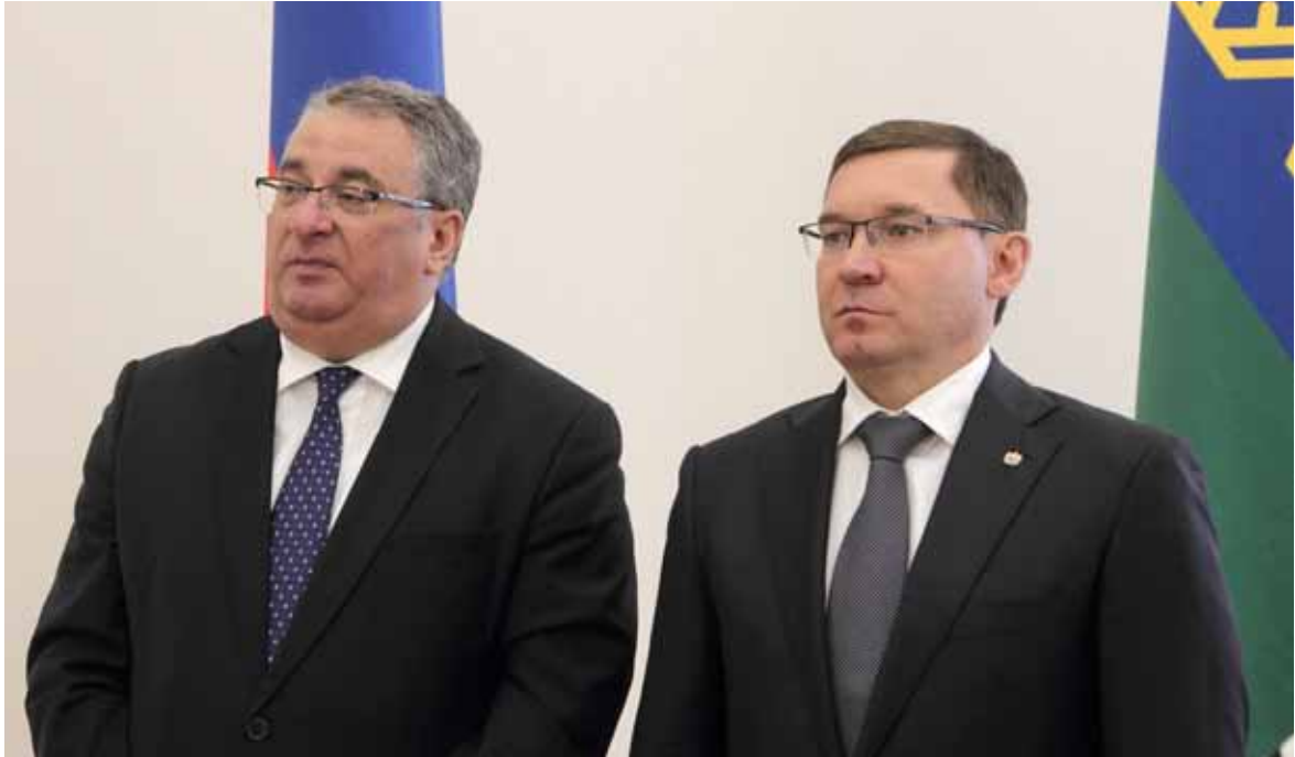
Фото пресс-службы губернатора