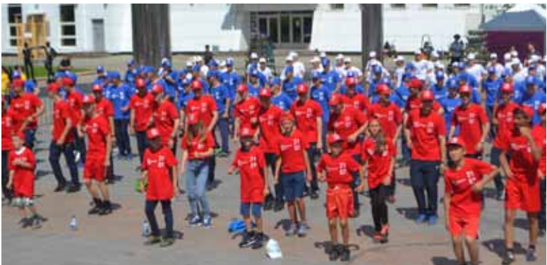
триколора и выстроились перед сценой. После того, как прозвучал гимн страны, начался мастер-класс, который провел боксер, заслуженный мастер спорта,