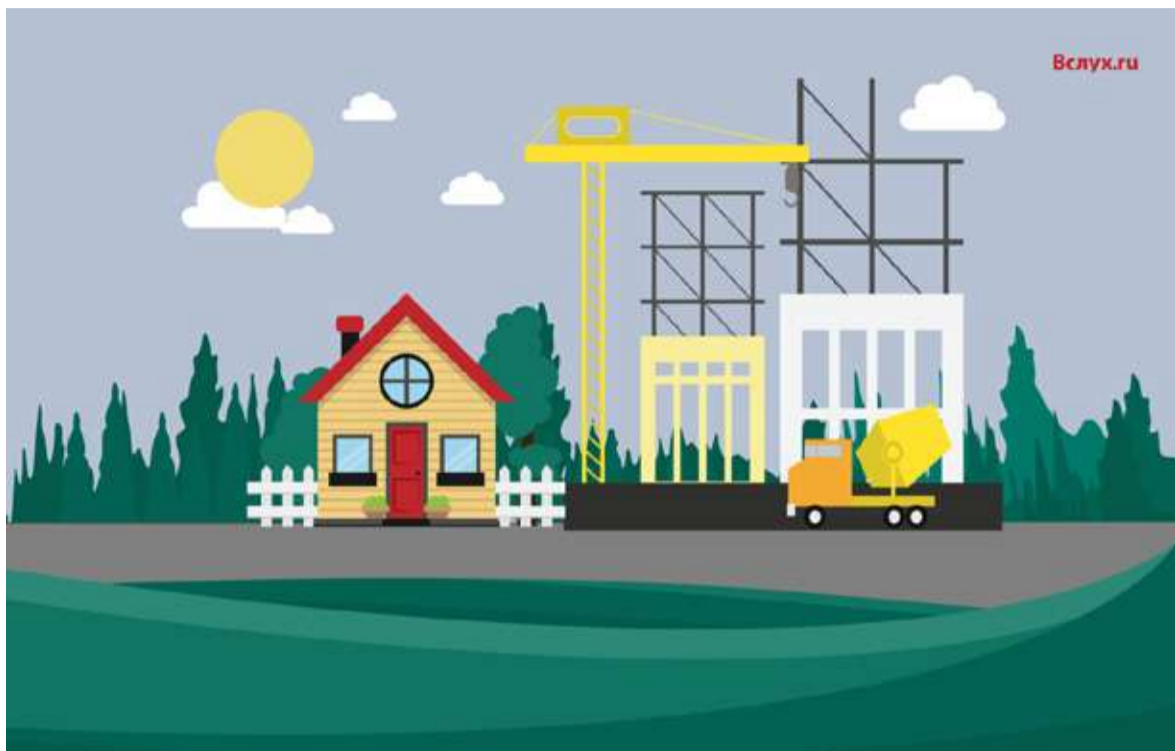
Иллюстрация Ольги Дмитриевой

«Значительно увеличился диапазон поиска земельных участков.