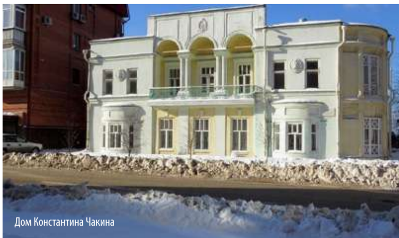
Дом Константина Чакина

В Тюмени в конце марта пройдет аукцион по продаже здания культурного наследия на ул. Семакова, 1. Начальная стоимость некогда жилого дома – усадьбы причты Знаменской церкви – 10 млн 630 тыс. рублей. Информация размещена на сайте Фонда имущества Тюменской области.