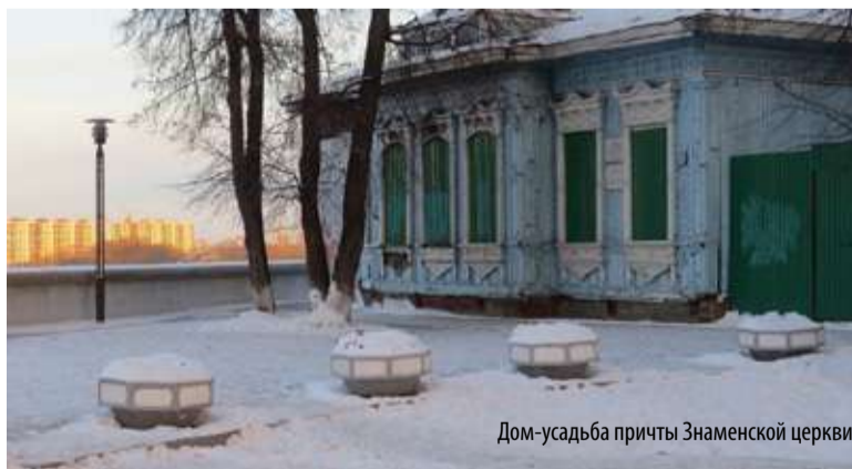
Дом-усадьба причты Знаменской церкви

Одноэтажный особняк построен в 1906 году в стиле русского модерна. Небольшой плоский ризалит в центре главного фасада акцентирован башенкой с фигурным сложным куполом. Совершая поездку по Западной Сибири, 12–14 сентября 1897 года в этом доме останавливался русский флотоводец, океанограф вице-адмирал Степан Макаров.