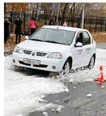
СРАВНИТЕЛЬНЫЙ ТЕСТ-ДРАЙВ 11 ГИБДД просит не тянуть резину