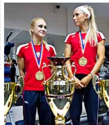
ЗОЛОТОЙ ФИТНЕС 15 Тюменки – лучшие в мире