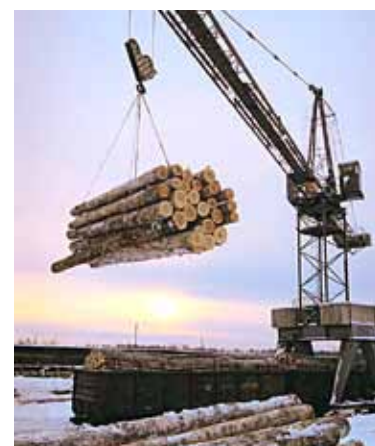
ЛЕСПРОМ БЕЗ ИНЕРЦИИ 7 От предприятий ждут инициативы