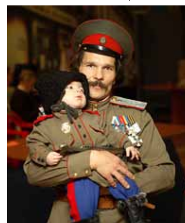
ОТЦЫ И ДЕТИ 12 Казаки задумались о будущем