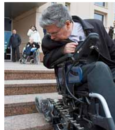
КОЛЯСКА СТУПЕНЕЙ НЕ БОИТСЯ Премьера в технопарке