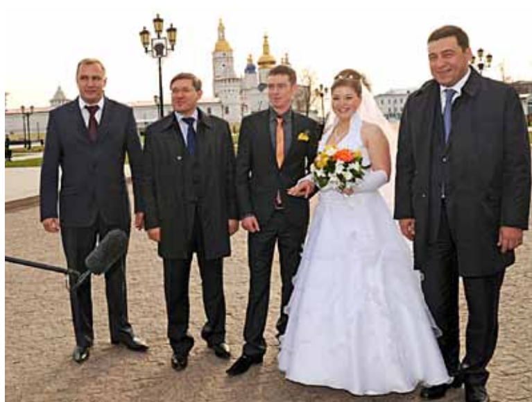
Глава администрации Тобольска Иван Оленберг, Владимир Якушев и Евгений Куйвашев с тоболяскими молодоженами

Он предложил тоболякам применить кластерный подход в развитии туротрасли. Напомним, в России планируется создать туристско-ре-