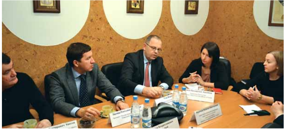
На встрече в Торгово-промышленной палате Тюменской области

Компании планируют не только реализацию продукции в Тюменской области, но и рассматривают