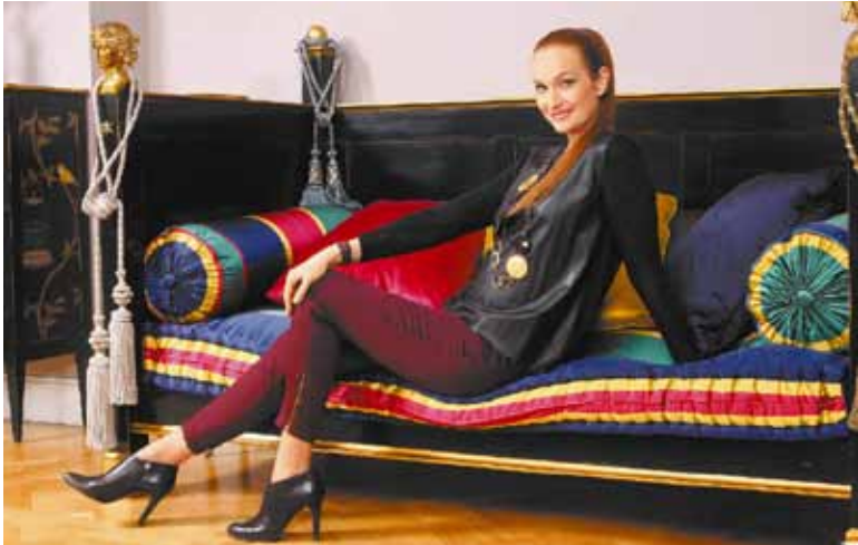
Материалы предоставлены САО «Сибинформбюро». Резюме

красивую картинку. Что касается меня лично, ходить по магазинам не люблю. Просто всегда точно знаю, что мне нужно, и не делаю лишних телодвижений. Хочешь больше модных советов от Таши Строгой и Наташи Стефаненко? Смотри шоу «Снимите это немедленно!» по субботам в 11:30 на СТС.