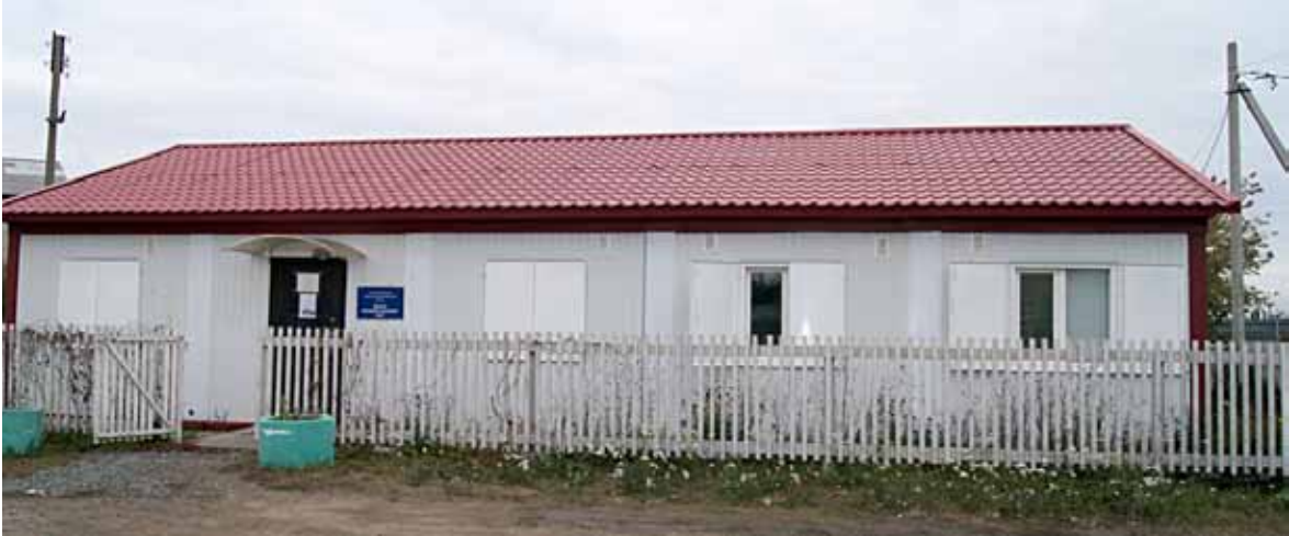
Фельдшерско-акушерский пункт, п. Яр (Тюменский р-н)

менские распределительные сети проводят технологическое присоединение мобильных ФАПов к электрическим сетям – с начала 2013 года на юге области подключено около 55 мобильных пунктов, до конца года планируется подклю-