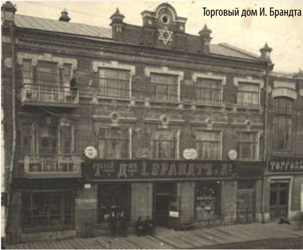
Торговый дом И. Брандта