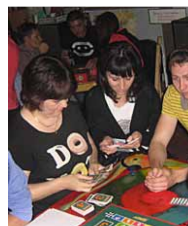
8 БИЗНЕС ПО ИНТЕРЕСАМ Дело – в увлечениях