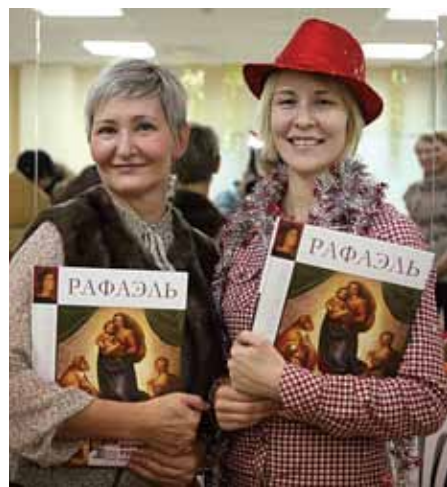
Подарки от портала «МегаТюмень»