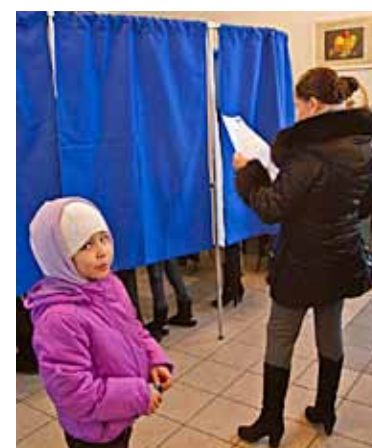
4 ОДИН ДЕНЬ В ШТАБЕ Выборное закулисье