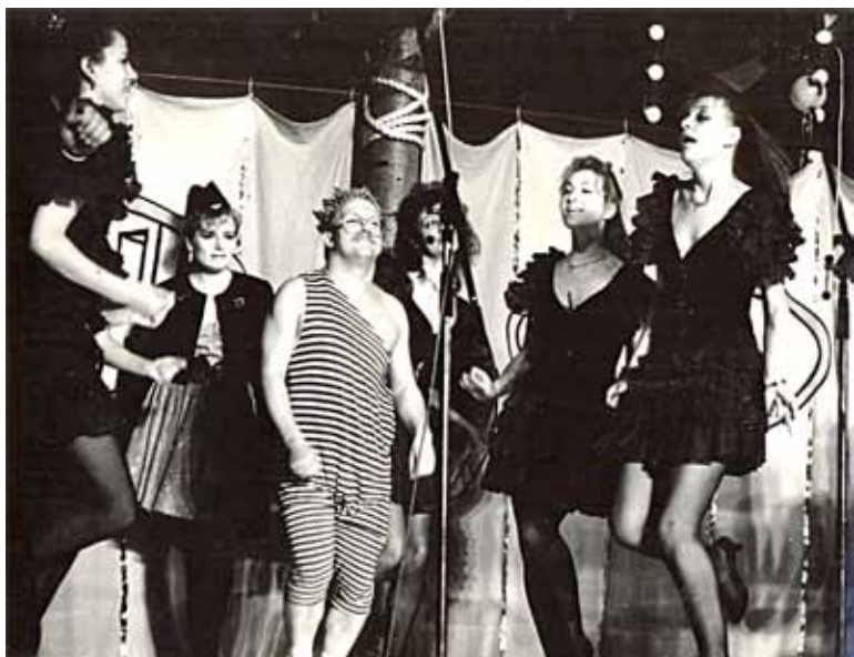
«Нефтяные короли» на игре в Москве

— В Высшую лигу команда попала после второго областного этапа?