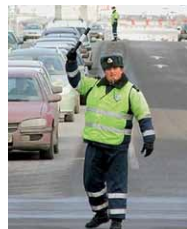
2 ГИБДД УЧИТ Пока по-доброму