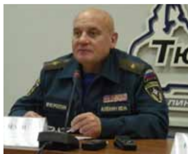
ду начальник ГУ МЧС Тюменской области Юрий Алексин .

«Отрадно, что в этом году люди чаще пользовались специально отведенными местами для отдыха в лесу. Однако с помощью сотрудников полиции приходилось выдвигать из лесов явных нарушителей. Только сотрудники МЧС составили на них более 390 административных протоколов», — отметил на пресс-конференции по итогам деятельности в этом го-