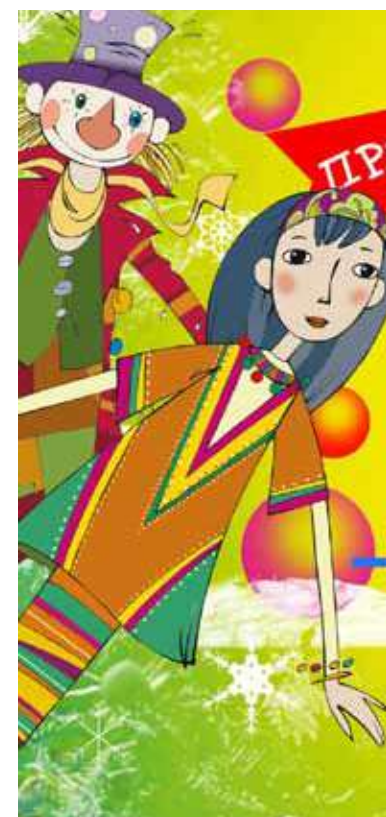
Материалы подготовила Ирина Пермякова

Впрочем, схематичность героев не убавляет зрелищности спектакля: история увлекательная, куклы миловидные, зловещий замок Бастинды и огромные красные маки радуют глаз. На премьерных показах зал был переполнен и, кажется, кроме совсем крошечных младенцев, напуганных скрипом железного дровосека и мрачными чертогами Бастинды, все покидали театр в хорошем настроении.