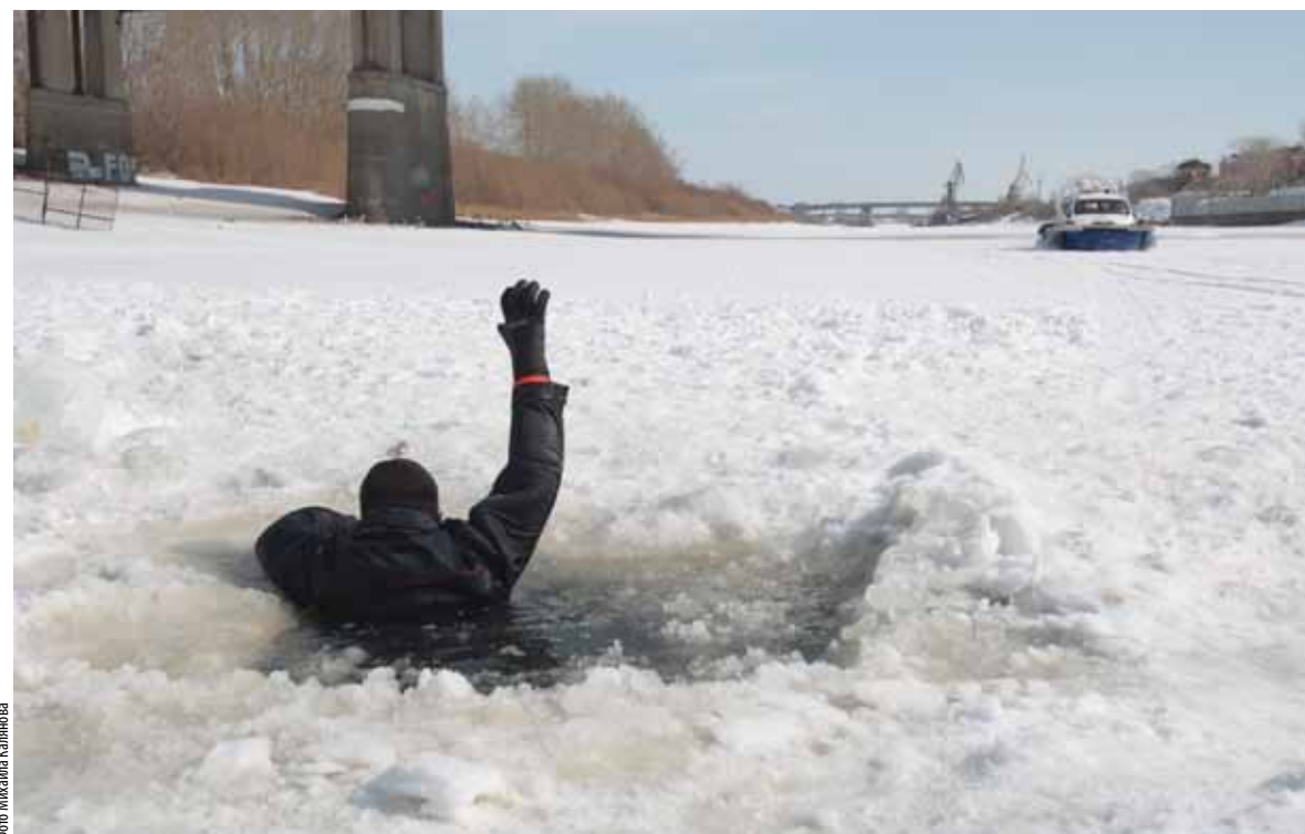
Показательная тренировка МЧС по спасению из холодной воды