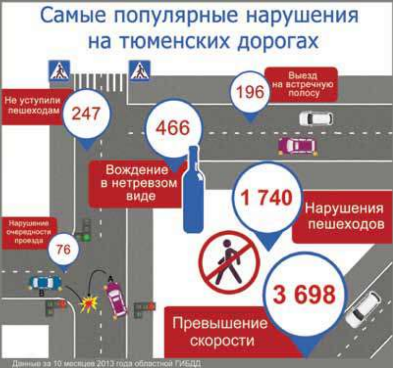
Подробнее – на www.vsluh.ru