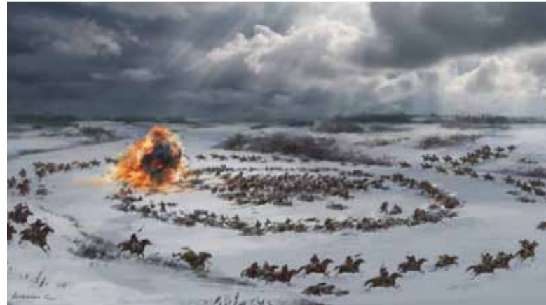
Рисунок Сергея Алибекова

Съемки «Тобола» – восьмисерийного сериала и полнометражного фильма – должны стартовать в начале 2017 года. Фильм планируется выпустить в прокат к концу 2018 года. Этим летом в Тобольске планируется построить усадьбу картографа Семёна Ремезова, которая после съемок станет музейным объектом. Проектируются костюмы, запланировано строительство исторических судов