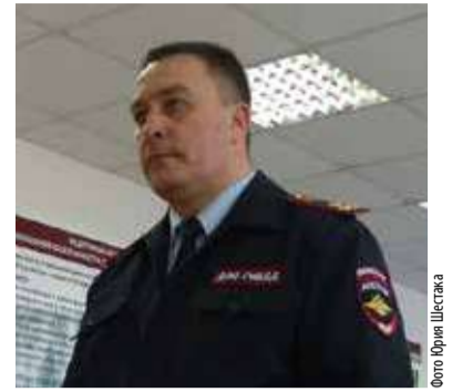
Михаил Киселев , начальник УГИБДД Тюменской области (назначен приказом министра МВД 6 июня 2016 года)

«Я постараюсь сделать все, чтобы дорожное движение в регионе было комфортным и безопасным для его законопослушных участников. К нарушителям, особенно практикующим опасное вождение, будут применяться адекватные меры реагирования и административного воздействия».