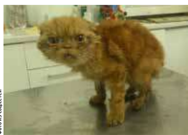
Фото на соц.сети