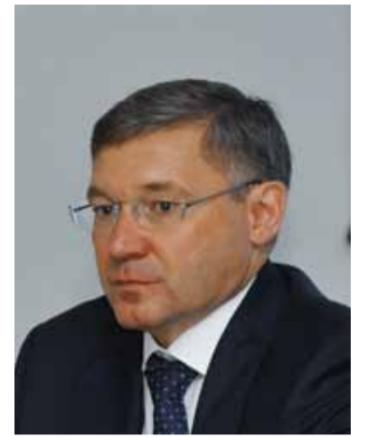
Владимир Якушев, губернатор Тюменской области

«Несмотря на имеющиеся трудности, нам предстоит в полной мере и достойно выполнить все свои обязательства (по проведению в 2016 году в Тюмени чемпионата Европы по биатлону. – Прим. ред.). Это серьезное и ответственное испытание, своего рода экзамен, по результатам которого IBU будет рассматривать наш регион в качестве кандидата на проведение чемпионата мира по биатлону».