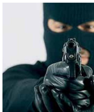
Обстоятельства преступления устанавливаются.

Несмотря на оперативность и моментальную реакцию полицейских, налетчику удалось скрыться через окно. Он разыскивается сотрудниками полиции. Налет сняла камера наружного видеонаблюдения, запись поможет сыщикам установить личность злодея.