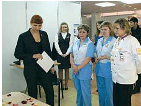
Жюри оценивает работу