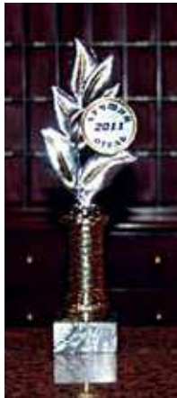
Кубок победителя – «Лучший отель-2011»