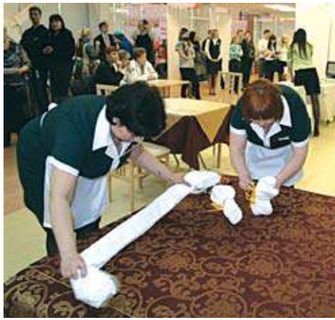
Отель «Малахит», г. Челябинск – 3-е место