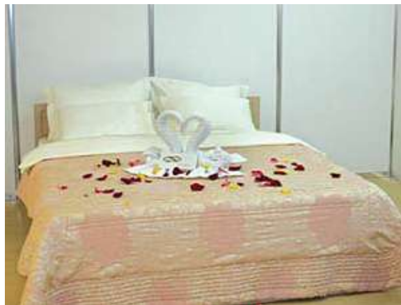
Конкурсная работа горничных Отеля «Тюмень»