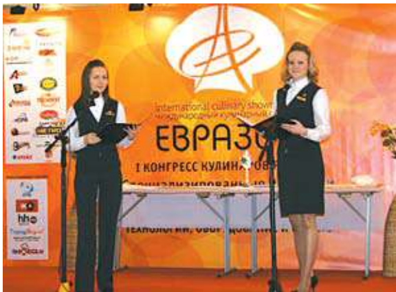
Конкурс администраторов: презентация Отеля «Тюмень»