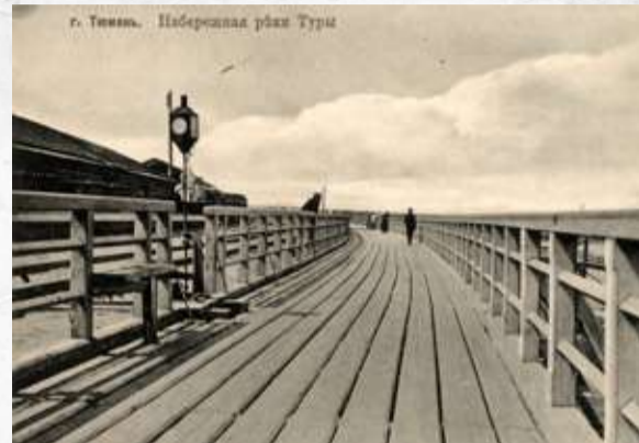
Иллюстрация из фотодокумента «Мужского комитета», И. Я. Спасского

Летняя площадка. Комиссия внешкольного руководства учащимися женской гимназии и реального училища организует летнюю площадку в саду женской гимназии, а также гимнастический и спортивный кружок. Площадка открыта с 10 до 12 часов дня и с 4 до 7 часов вечера ежедневно, кроме субботы. Запись желающих посещать площадку проводится в часы посещения руководителем площадки. Лотерея-аллегри. Тюменским комитетом Всероссийского союза городов, 4 июня, в доме Шайчика (под клубом) организуется лотерея-аллегри в пользу погорельцев г. Барнаула. Главные выигрыши: швейные машины, самовары, белье и т. д. Гранд-электротheater «Вальдемар». С 1 июня – потрясающая драма в 5-ти частях «Потомок дьявола». С 4 июня – роскошная картина, чудная драма-сказка-аллегория «Лилия Бельгии» постановки реж. Старевича.