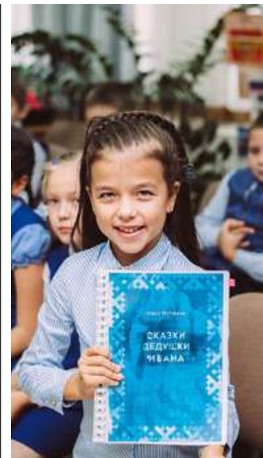
Фото организаторов фестиваля