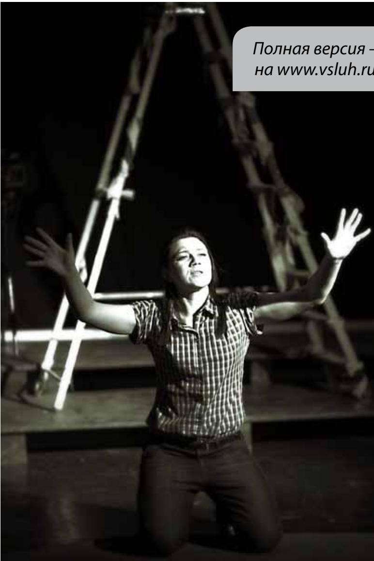
Полная версия – на www.vsluh.ru

гедии: где та черта, которую важно не переступить? – Очень хорошая идея поместить зрителей в центр событий, посадить на крутящиеся стулья. Это дало максимальное погружение в действие. – С этого решения и началась работа над спектаклем. Потому что оно полностью реализует мысль: это мир, в котором мы живем и в котором очень много всего происходит, и ощущение, что человек – центр мироздания, он в гуще событий, но ничего не может сделать. В его праве выбирать, на что смотреть: есть бой Гамлета с Лаэртом и есть Офелия. К чему лежит твоё сердце? Что тебе интересно? Битва героев или наблюдающая за этой битвой уже мертвая девушка? – Куда движется «Мимикрия»? – К профессиональному театру. У нас есть опыт, силы. Но нет дома,