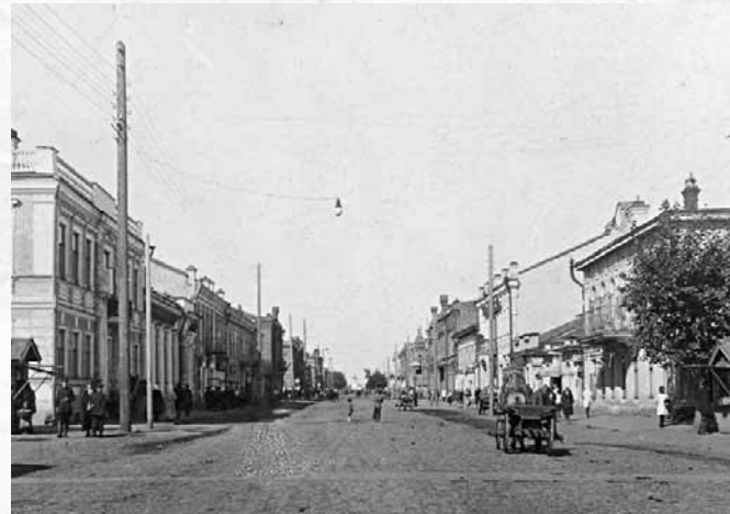
Угол Царской и Иркутской