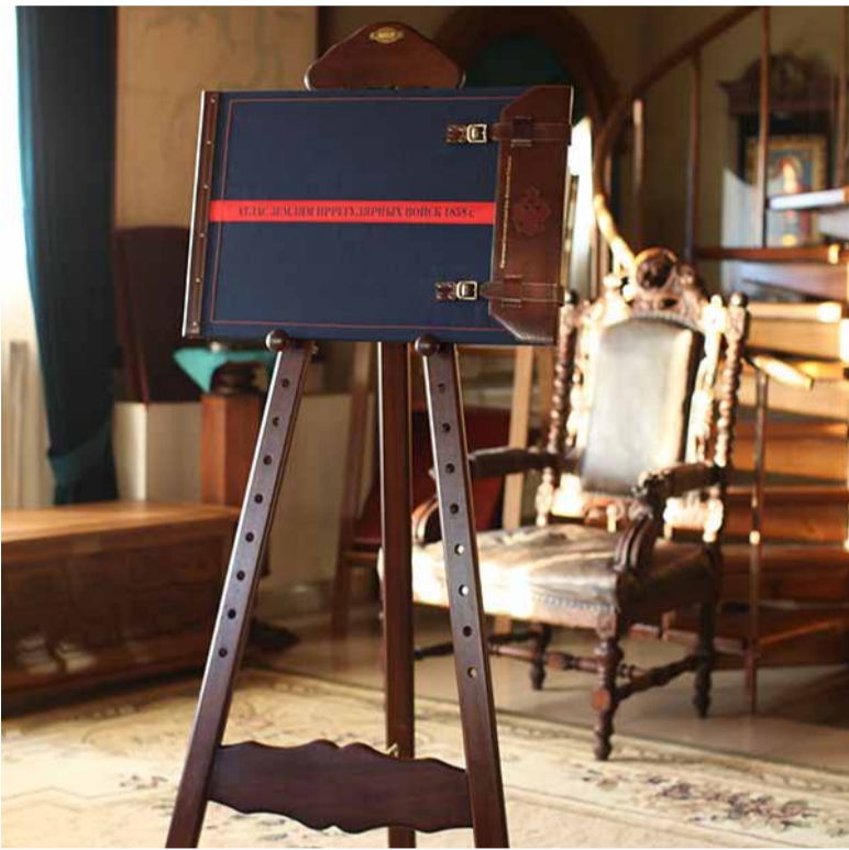
«Атлас земель иррегулярных войск 1858 г.»

В конце минувшей недели были названы лучшие книги, изданные в Тюменской области в 2014 году. И хотя среди представленных изданий было немало произведений уральского издательского искусства, тюменские книги взяли солидное количество «Серебряных литер» – главных наград конкурса.