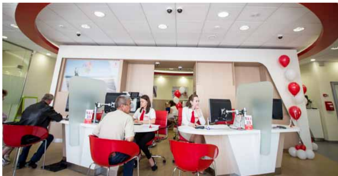
Генеральная лицензия Банка России №1326 от 5 марта 2012 г. Реклама