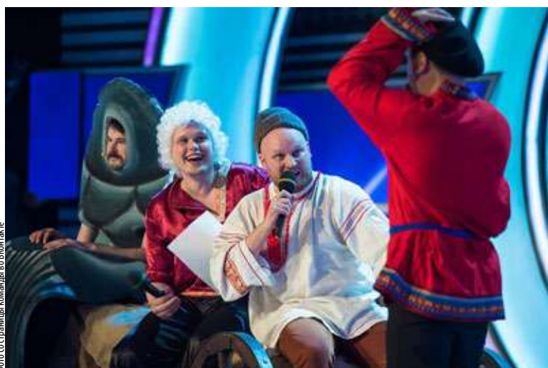
Фото со стороны команды во Владивостоке