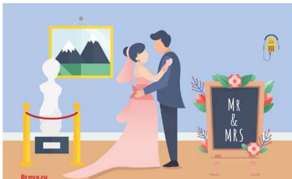
Иллюстрация Ольги Дмитриевой

Это делается, чтобы поднять статус государственной регистрации брака и вывести организацию выездных регистраций на высокий уровень. «У молодежи большой интерес к выездным регистрациям, им хочется чего-то другого. Наши дворцы культуры и драмтеатр подходят для этого. Сейчас выездные регистра-