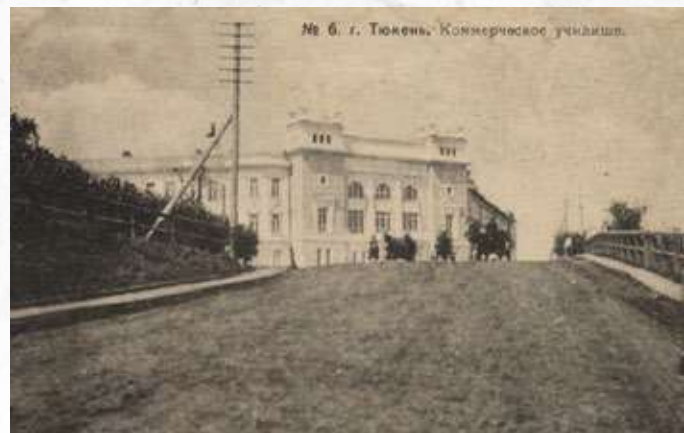
Иллюстрация из фондов Музейного комплекса им. И. Я. Соловьева