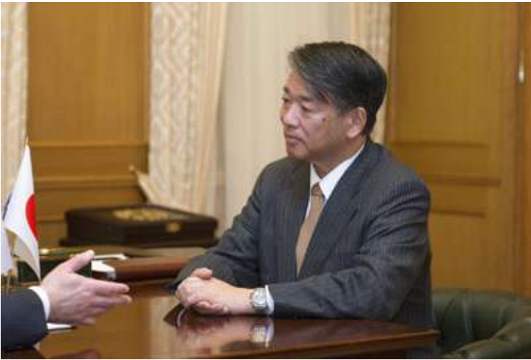
Сергей Корепанов, председатель Тюменской областной думы

Японские бизнесмены в составе официальной делегации во главе с чрезвычайным и полномочным послом Японии в России Тоёхиса Кодзуки 12-13 октября посетили Тюменскую область и провели ряд встреч с представителями официальных и деловых кругов региона.