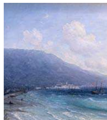
12 «ВЕЛИКИЕ РЕАЛИСТЫ» Три музея – одна выставка