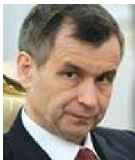
Рашид НУРГАЛИЕВ, министр внутренних дел России, генерал армии

Есть тут и еще одна «занятная» статистика. С прошлого года мы начали тестировать кандидатов на предмет употребления наркотических средств, выявления алкогольной зависимости. Так, узнав об этом, около 12 процентов абитуриентов, поступающих в наши ведомственные вузы, отказались от сдачи вступительных экзаменов!»