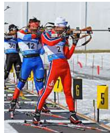
3 БИАТЛОН В УВАТЕ Тюменцы нацелились на Сочи