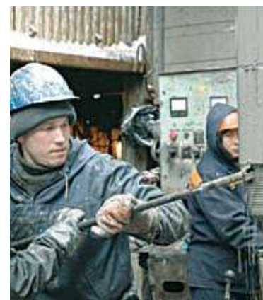
5 НЕФТЕГАЗОСЕРВИС В РОССИИ Рынок захвачен?