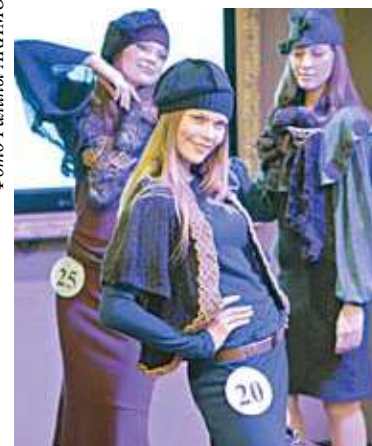
13 «ИМИДЖ-2011» Pre-party и немного грусти