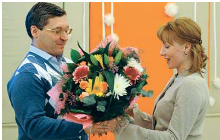
Владимир Якушев и Альбина Ахатова

Среди участников встречи в «Жемчужине Сибири» была выдающаяся спортсменка Альбина Ахатова . Повод оказался грустным – биатлонистка прощается с большим спортом.