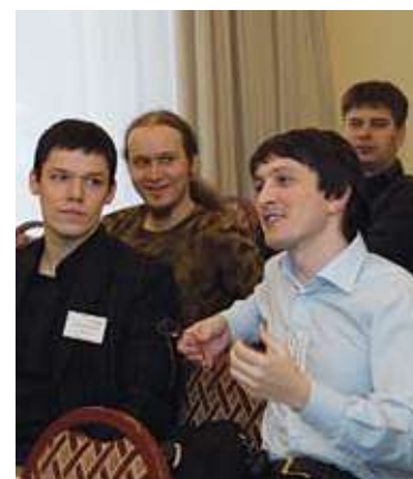
8 ИНТЕРНЕТ ДЛЯ БИЗНЕСА Публика не спешит в гардероб