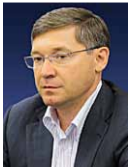
Владимир ЯКУШЕВ , губернатор Тюменской области

«Только за 2011 год машин в Тюмени стало на 18% больше, а загруженность объездной дороги вышла на уровень, который специалисты прогнозировали к 2018 году... Наряду со строительством новых дорог, повышением эффективности работы дорожных служб и ГИБДД важно формировать культуру поведения на дорогах... Нужно запустить информационную волну, порицать нерадивых автомобилистов, бросающих машины на дорогах и во дворах, нарушающих скоростной режим, правила дорожного движения».