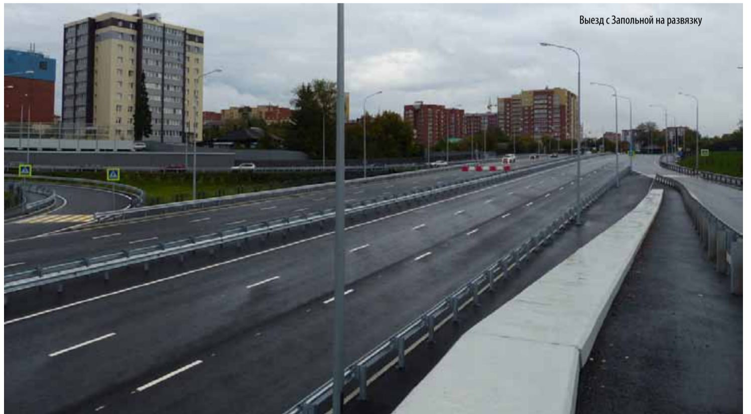
Выезд с Запольной на развязку

Помимо строительства канала, в который закрыли Тюменку, нужно было еще отводить грунтовые воды. Для этой цели вдоль дороги создавалась система дренажей. Грунтовые воды также уходят в ливневую канализацию. Перед сбросом в Туру вода проходит через локальные