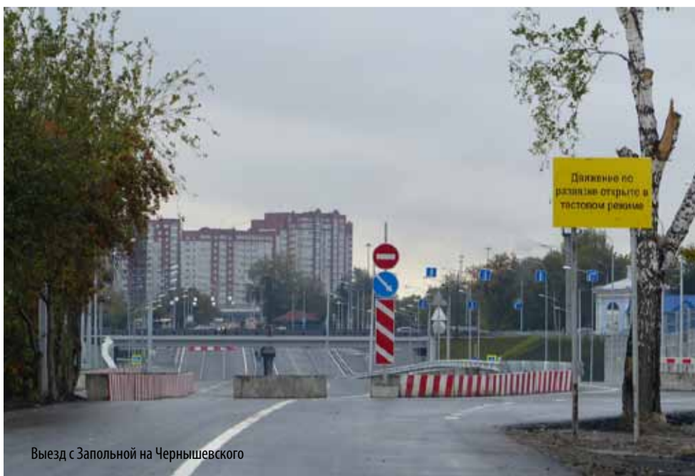
Выезд с Запольной на Чернышевского