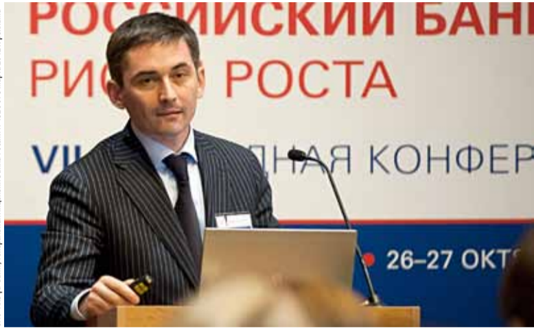
ООО «Альфа-Банк», Генеральная лицензия Банка России №1326 от 5 марта 2012 г., реклама

Ольга Макарова