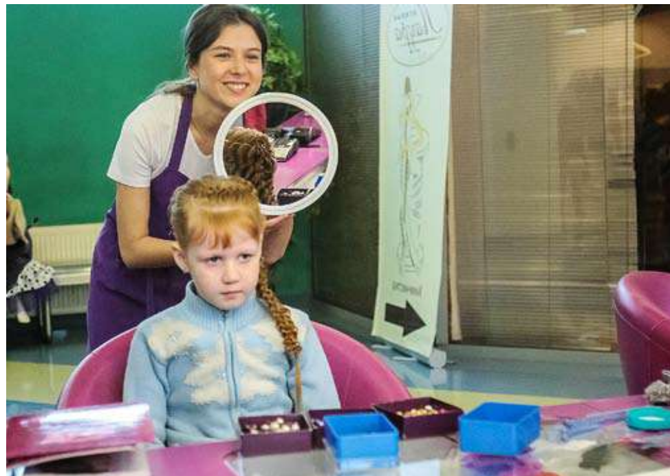
Рая закончила очередной шедевр

Алена Бучельникова