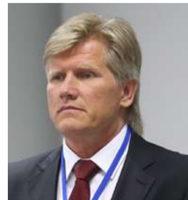
Дмитрий Васильев , двукратный олимпийский чемпион по биатлону об отстранении от Олимпиады-2018 чистых российских спортсменов

«Придется везти тех, кто есть. Но мне представляется участие в такой Олимпиаде унижительным. Нас просто обезглавили, выбили всех лидеров. Зачем ехать на такие Игры? Если над нами так издеваются, то и в Пхенчхане будут продолжать, еще что-то придумают. Как можно сотрудничать с МОК в таких условиях, когда правила меняются на ходу, причем только для одной конкретной страны?! А спортсмены из других стран терапевтическими справками обкладываются. Превратили олимпийское движение в посмешище».