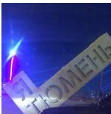
Фото из соцсетей