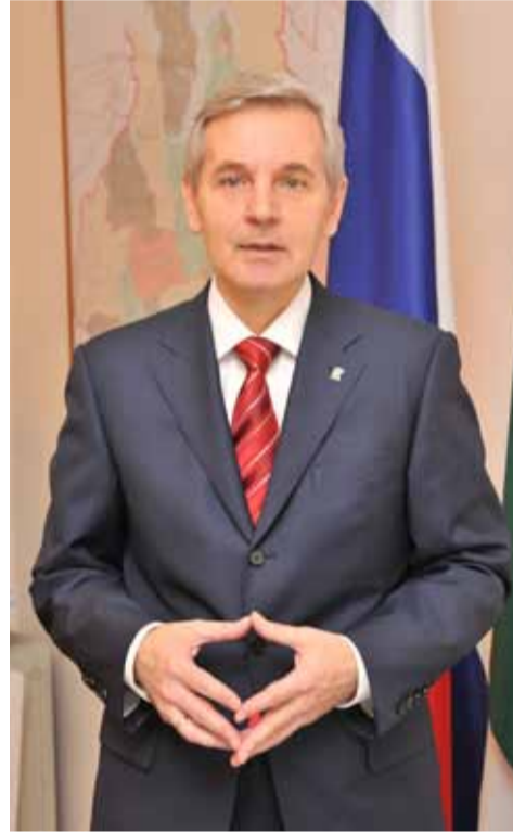
телям различного уровня законодательной и исполнительной власти региона, депутатам Государственной думы, членам Совета Феде-

– Наиболее эффективной и востребованной формой работы в приемной председателя партии является личный прием граждан. У тюменцев есть реальная возможность обратиться со своими конкретными вопросами, проблемами и предложениями к представи-