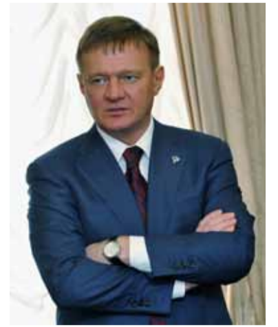
Роман Старовойт , руководитель Федерального дорожного агентства (Росавтодор)

«В Тюменской области в этом году будет выполнен большой объем ремонтных работ на федеральных автомагистралях, чем было запланировано ранее. Проехав по федеральным трассам региона, я убедился, что они требуют особого внимания. Уверен, состояние дорожной сети Тюменской области должно соответствовать успешной и масштабной работе, которую регион проводит по привлечению инвестиций, развитию туристического и спортивного кластеров».