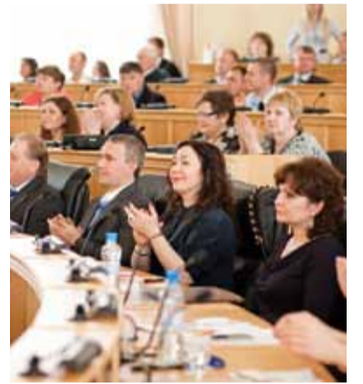
5 ДЕНЬ ПРЕДПРИНИМАТЕЛЯ Вызовы и перспективы