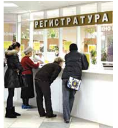
14 ОМС Переходный период