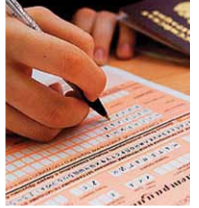
2 ЕГЭ Старт дан!