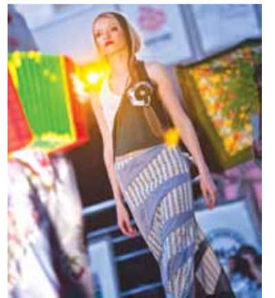
17 «РУССКИЙ СИЛУЭТ» Тюменка взяла Гран-при