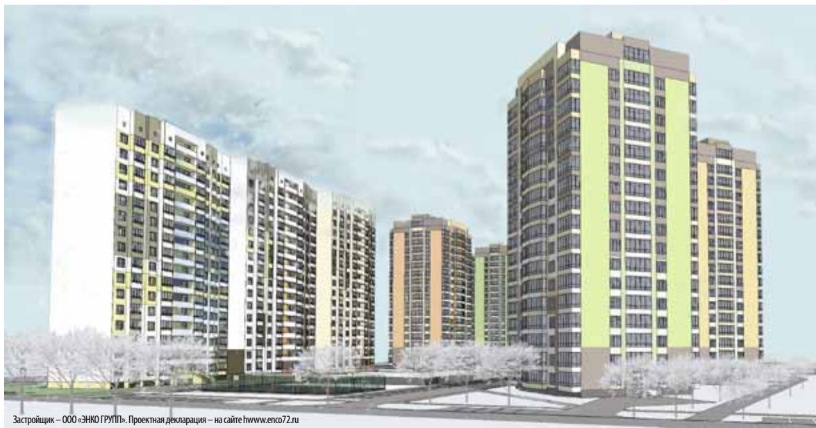
Застройщик – ООО «ЭНКО ГРУПП». Проектная декларация – на сайте www.enko72.ru

В феврале в Преображенском откроется отдел продаж. Поэтому оценить ход строительства и купить квартиру можно будет в одном месте.