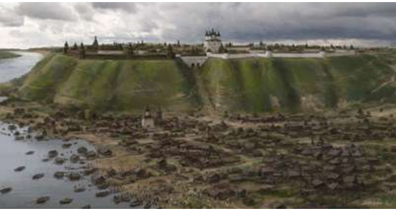
Иллюстрация ассоциативной сети