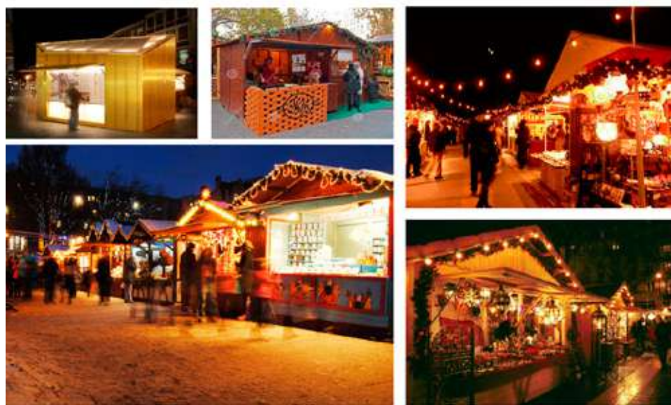
Функциональное наполнение в зимнее время года.