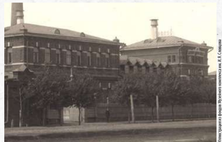
Иллюстрация из фондов Музейного комплекса им. И. Я. Савцова