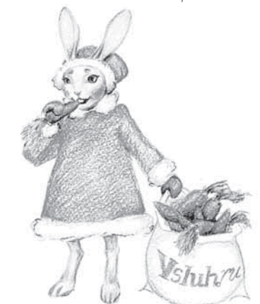
ГОД БЕЛЫЙ И ПУШИСТЫЙ 12-13 Гороскоп на 2011-й