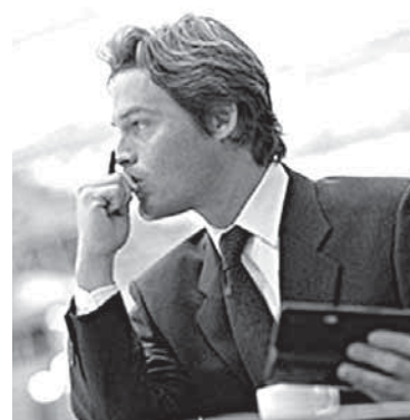
6 ДЕЛОВЫЕ ВПЕЧАТЛЕНИЯ Бизнес подводит итоги