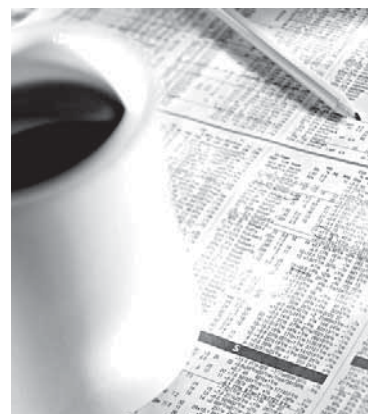
11 ЗАПИСКИ ИНВЕСТОРА Что было, что будет...