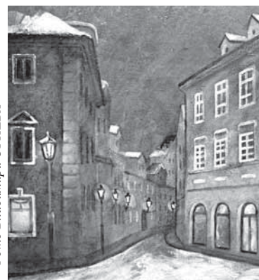
14 ФИЗИКА, ПРОШЛОЕ И ХУДОЖНИК Выбирая выставку