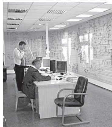
3 НОЧЬ ДЕЖУРНЫХ ПО СТРАНЕ Праздник – на посту