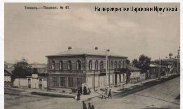
Тюмень, — Тюмень, № 41.