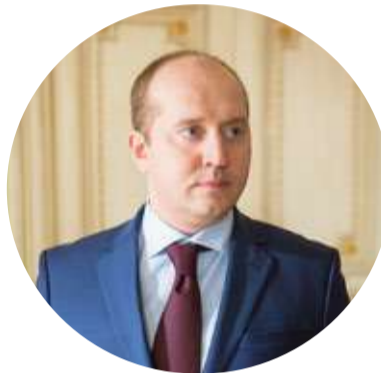
Антон (Сергей Бурунов)

Владелец преуспевающего автосалона, один из самых успешных бизнесменов области. Единственный в семье, кто ставит ударение в фамилии на второй слог. Антон ведет себя как типичный нувориш и постоянно говорит о своем благородном происхождении, несмотря на то, что его прадед был безграмотен. Кроме того, он привык получать все, что захочет: например, увидев у друга домашнюю рысь, заказывает в Польше такую же, потратив кучу денег.