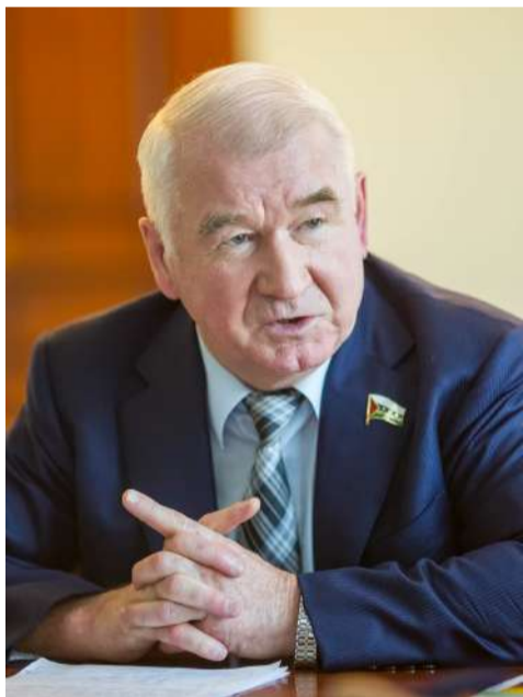
Сергей Корепанов, председатель Тюменской областной думы:

Изменения касаются выделения дополнительных финансовых средств для приведения в нормативное состояние дорог, проведение реконструкции, а также проектирование реконструкции участков автодорог федерального значения Р-402 Тюмень – Ялуторовск – Ишим и Р-404 Тюмень – Тобольск – Ханты-Мансийск. В рамках совместного с облдумой проекта «Общественная экспертиза» и еженедельника «Вслух о главном» дорожники, ученые и чиновники рассказали о перспективах дорожного строительства в регионе, ремонтной кампании и взаимоотношениях с Федерацией.