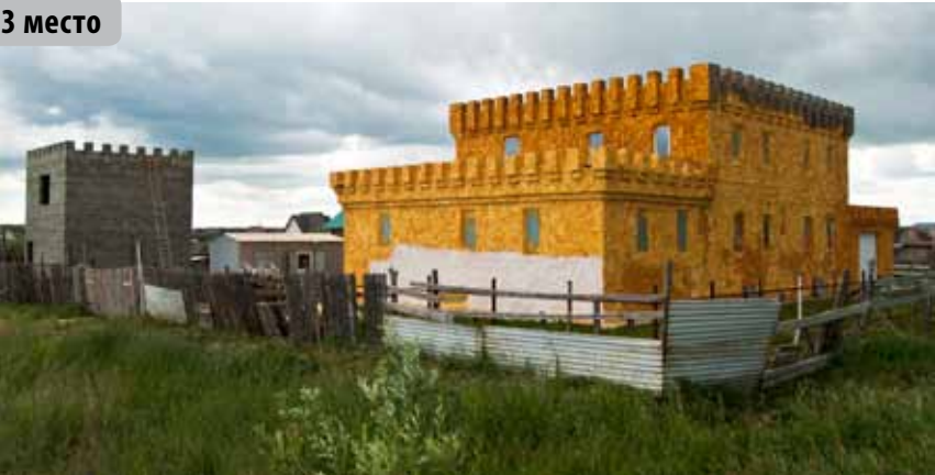
Инфернальный Спанч Боб, поселок Березняки