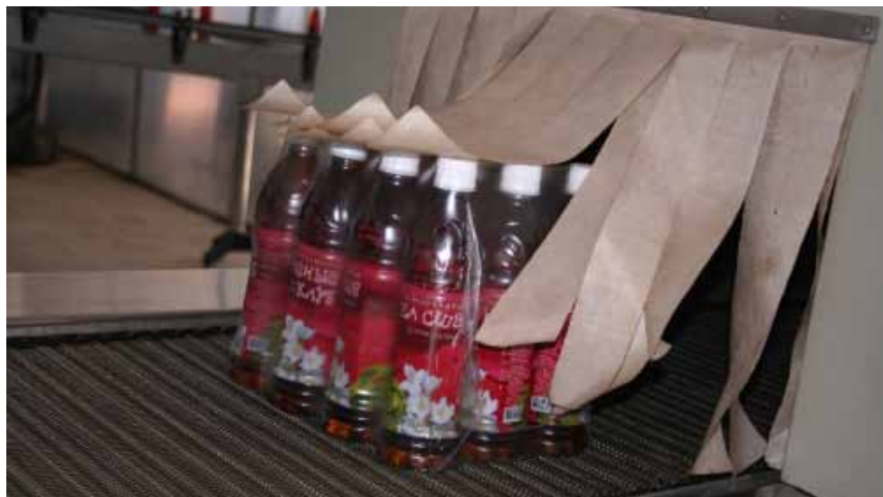
Продукция ООО «Биовек»