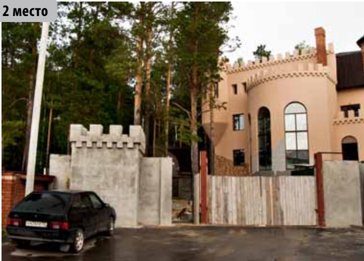
Лесная твердыня, деревня Патрушево