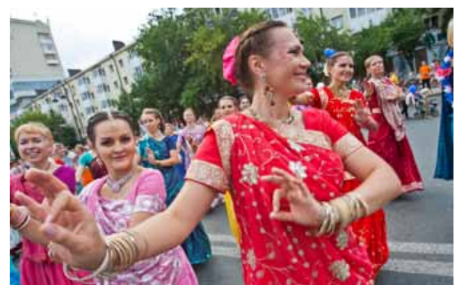
Праздничное шествие в День города, 2012 г.