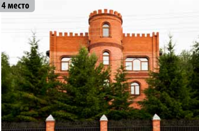
Сторожевая башня, деревня Патрушево