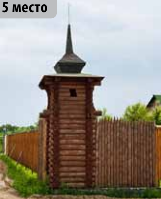
Настоящий сибирский острог, садовое общество «Строитель», Салаирский тракт

Замки искал Аюр Ербактанов