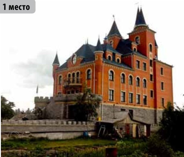
Замок для принцессы, садовое общество «Солнечное», Андреевское озеро