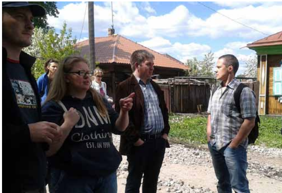
Участники бесцельных блужданий по Затюменке со Львом Боярским

Маршруты: участники поездок выбирают цель – Ирбит, старинный Шадринск, село Будка, где