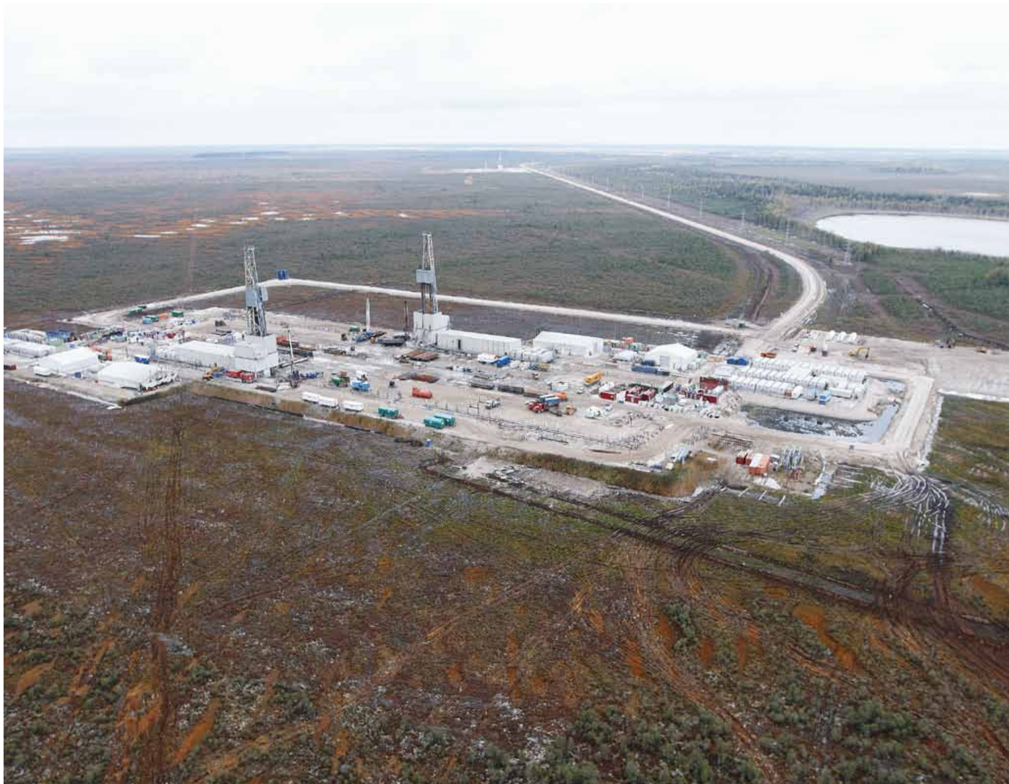
Усть-Тегусское месторождение Уватского проекта