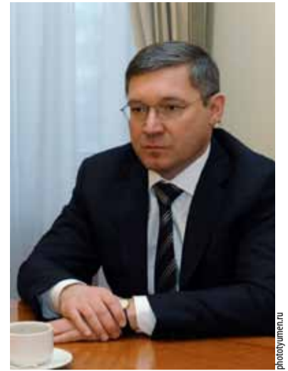
Владимир Якушев, губернатор Тюменской области

«Действительно, НДС составлял существенную часть областного бюджета – 38 процентов. Поэтому говорить, что мы за два года возместим эту цифру за счет открытия новых производств, я не буду. Но если мы и дальше сохраним высокие темпы развития области, думаю, что в перспективе через 8-10 лет можем достичь прежних бюджетных показателей. Мы неплохо поработали над развитием социальной сферы, АПК, инфраструктуры, что привлекает в регион инвесторов. У нас создан хороший задел на будущее, нужно просто засучить рукава и серьезно работать. Для достижения результата каждый должен на своем месте создавать свое собственное маленькое экономическое чудо».