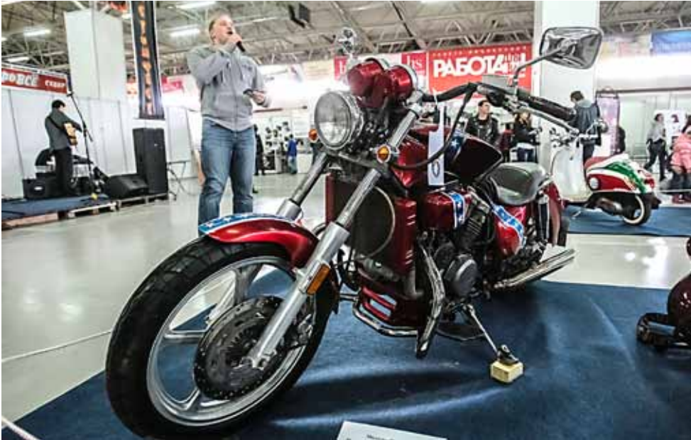
Navel Jack – Honda Magna 45