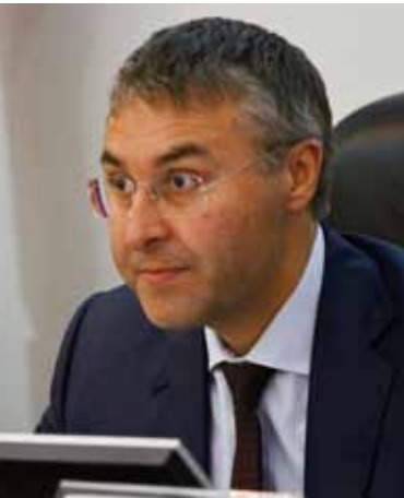
Валерий Фальков , председатель Совета ректоров вузов Тюменской области, ректор ТюмГУ

«В вузах должно быть сложно учиться. Студенческие годы – не променад с белым пуделем, это серьезный и ответственный труд, который должен отнимать у молодого человека львиную долю времени. А есть те, кто посещает одну-две пары с мыслью – «а все равно меня не отчислят». Вопросы задолженности и отчисления будут стоять по-другому. «Вход» в вузы усложнится уже со следующего года. Должно быть одинаково тяжело поступить в любой вуз, независимо от того, какой он направленности. Все это будет сделано для повышения привлекательности региональной системы образования».