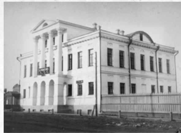
Иллюстрация из фонда Музейного комплекса им. И. Я. Слонова