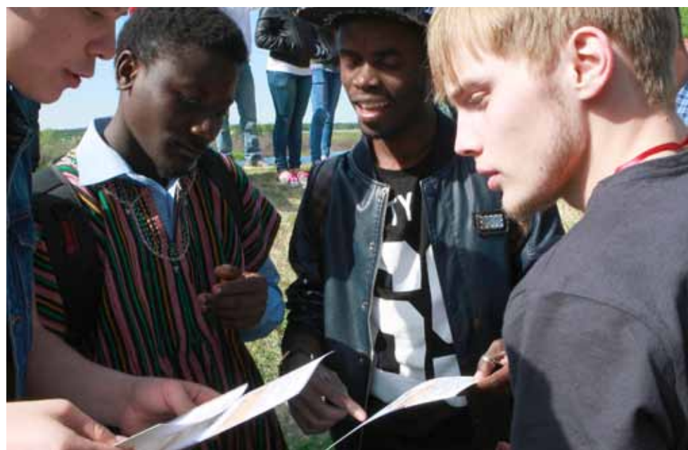
Их подружила Тюмень