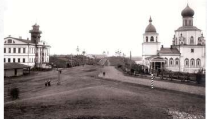
Иллюстрация из семейного архива Г. Г. Гуневой