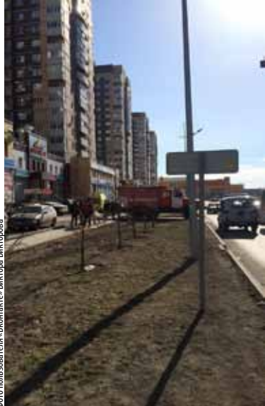
Фото полковника Виктора Викторовича