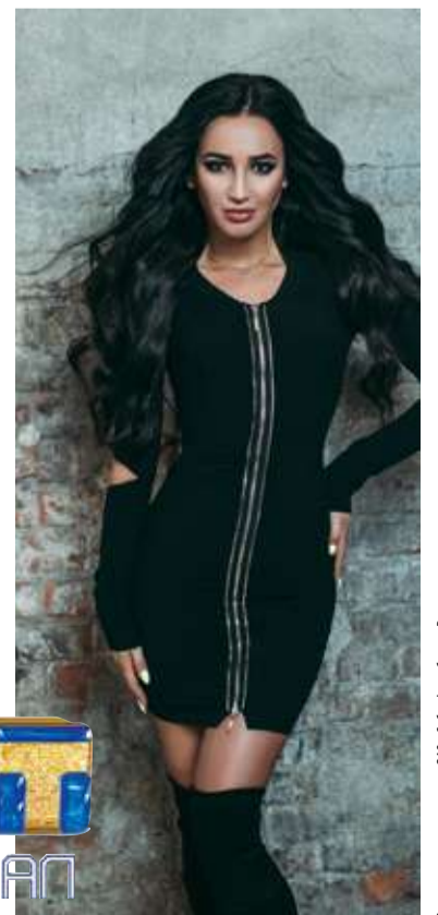
Материал подготовлен 340 «СпбИнформБюро». Реслама

TNT ищет мужчин в возрасте от 18 до 40 лет. Обязательное условие – холостой статус претендентов. Заполнить анкету можно на сайте zabuzovy.tnt-online.ru