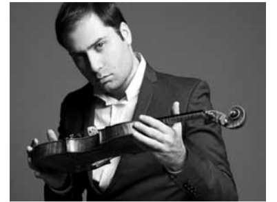
Дмитрий Коган , российский скрипач, заслуженный артист РФ.

«В 1990-е годы мы пережили кризис ценностей, когда то, что было внизу, оказалось наверху. Я учился в музыкальной школе и каждую неделю слышал о том, что кто-то из преподавателей уехал за границу. Сейчас мы возвращаемся, как мне кажется. Появляются новые залы, новые оркестры, ремонтируются музыкальные учебные учреждения».