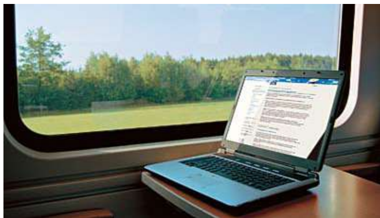
Генеральная лицензия банка России № 1000